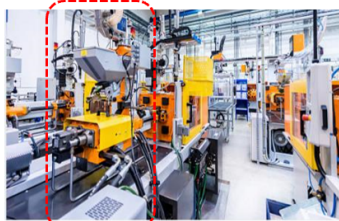
製造品加工設備：強度向上のため、バルブの表面熱処理加工を実施