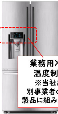
業務用冷蔵庫の 温度制御装置 ※当社出荷後、 別事業者の工場にて 製品に組み込まれます。