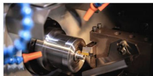
加工（シリンダ部分の切削）