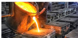
金型製作（チャンバー部品）