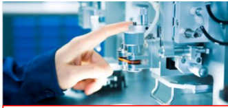
製造品テスト設備：感光性確認のため、センサー反応測定を実施