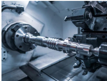
画像1 部品を切削加工する機械