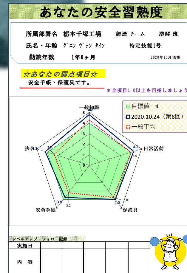
習熟度テストで、安全知識を個人評価