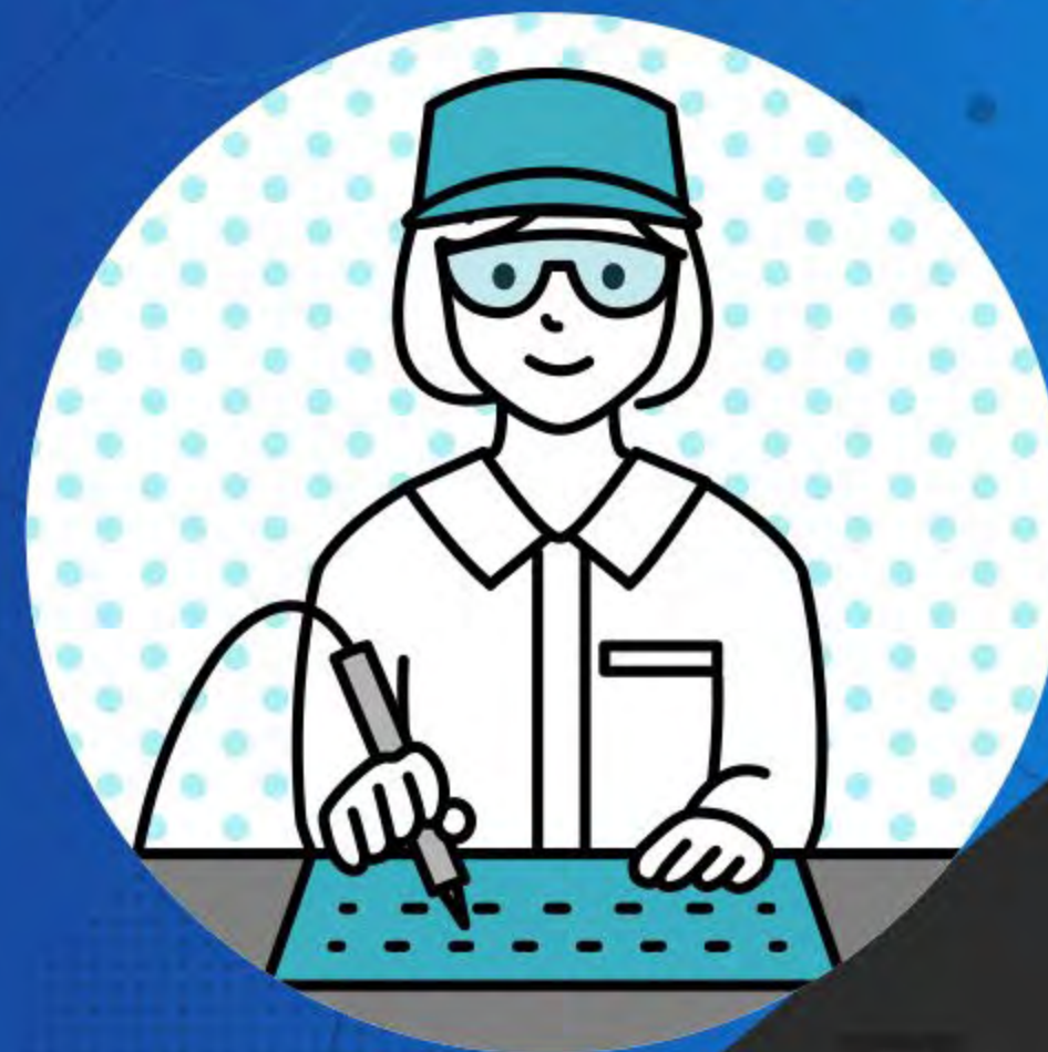
電気・電子情報 関連産業